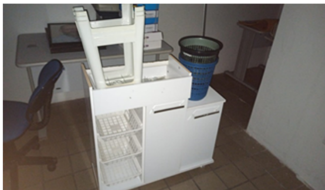
Imagem 01: Móveis da Entidade