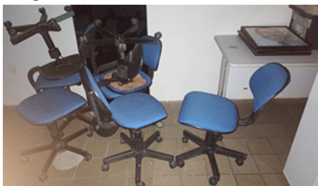
Imagem 02 : Móveis Escritório