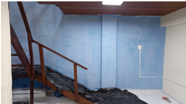
Imagem 15: Sala da Associação