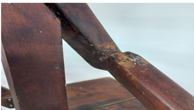
Imagem 17: Sala da Associação