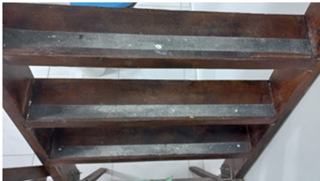
Imagem 16: Sala da Associação